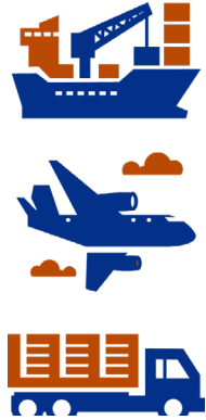
Gráfico 2. Costa Rica. Distribución porcentual de las exportaciones e importaciones, según tipo de transporte (datos preliminares)